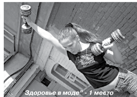
Здоровье в моде - 1 место

Что же такое фотокросс? Фотокросс – это творческие соревнования в условиях временных, тематических и инструментальных ограничений. Участников фотокросса называют кроссерами. Появилось это замечательное направление в России не так уж давно, а именно в 2004 году. Быстрыми темпами растет его популярность, и в эту увлекательную игру включаются все новые города нашей необъятной Родины, а также стран СНГ.